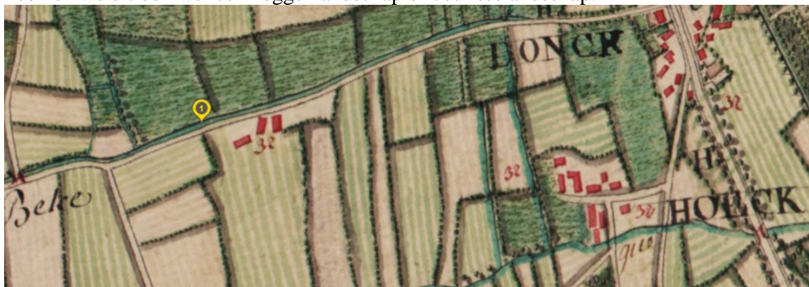
Ferraris van 1777

Op de kaart van Ferraris van 1777 zien we bij het nummer 1 drie gebouwen staan in een onregelmatige blokverkeveling. De percelen zijn ongelijk van vorm en grootte en dat is typisch voor een oud middeleeuws zandlandschap. Door de aanwezigheid van vele heggen noemen we dit ook wel een heggenlandschap of coulisselandschap.