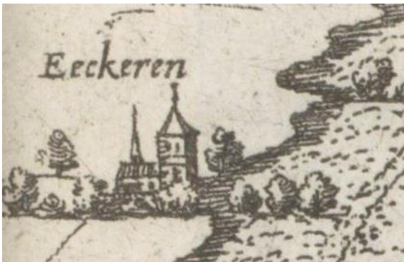
RP-P-OB-78.784-234 Dijken doorgestoken bij Antwerpen 1585 Frans Hogenberg

De drie bovenstaande afbeeldingen komen uit het Rijksmuseum van Amsterdam en zijn vergrotingen uit kaarten van Frans Hogenberg over de situatie in 1584/1585.