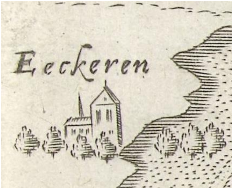
Forten en schansen langs de Schelde, 1584, Frans Hogenberg