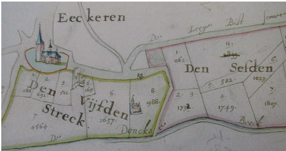
RAA Polder van Oosterweel nr. 1167: Oosterweel bedijkt in 1651 volgens kaartboek van 1657 door meester Adriaen Hendrick 'gesworen landtmeter'.

In 1657 blijkt de toren intussen voorzien te zijn van een ferme spits. De kerk ziet er naar verhouding wat groter uit en is nog steeds voorzien van een dakruiter. Een zijbeuk is zichtbaar. Het kerkhof rond de kerk is aangegeven.